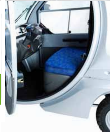
Perfekter Einstieg und Sitzposition