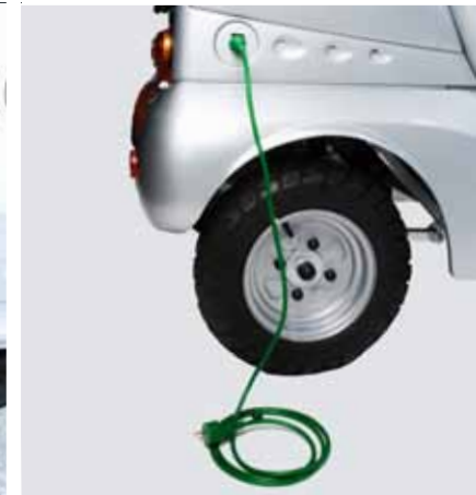
Einfaches Aufladen an jeder Haushaltssteckdose